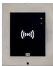
2N® ACCESS UNIT RFID

obj.č. 916009 (125kHz) obj.č. 916010 (13.56MHz)