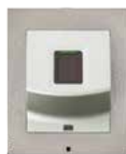
2N® ACCESS UNIT ČTEČKA OTISKŮ PRSTŮ