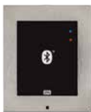
2N® ACCESS UNIT BLUETOOTH

obj.č. 916009 (125kHz) obj.č. 916010 (13.56MHz)