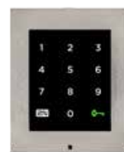
2N® ACCESS UNIT DOTYKOVÁ KLÁVESNICE